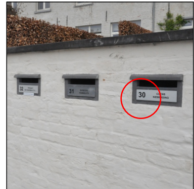
30 : 6 = 5 \rightarrow E