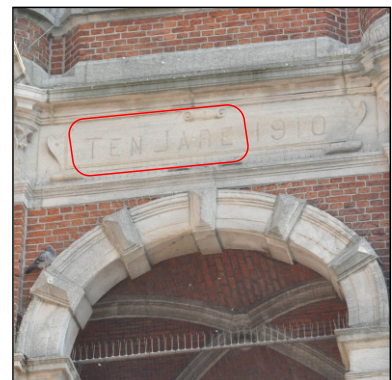
TEN JARE 1910