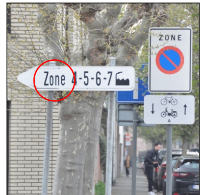
Zone 4 5 6 7